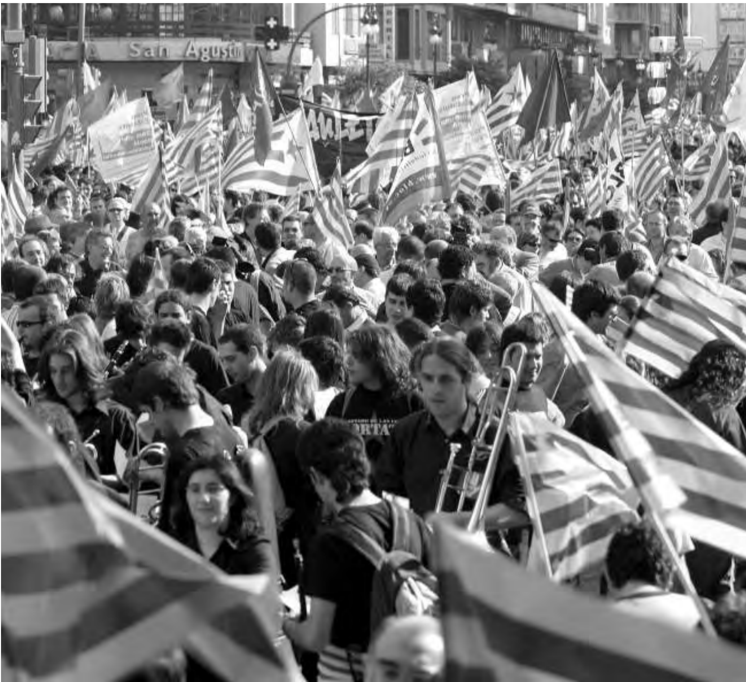
Manifestació per commemorar el 25 d'abril.

de La utopia necessària (1994), s'ha produït un esgotament de l'assaig de formulació política. «La realitat política ha desmentit la possibilitat de portar a cap determinades propostes, invalidades per la història», apunta el sociolingüista.